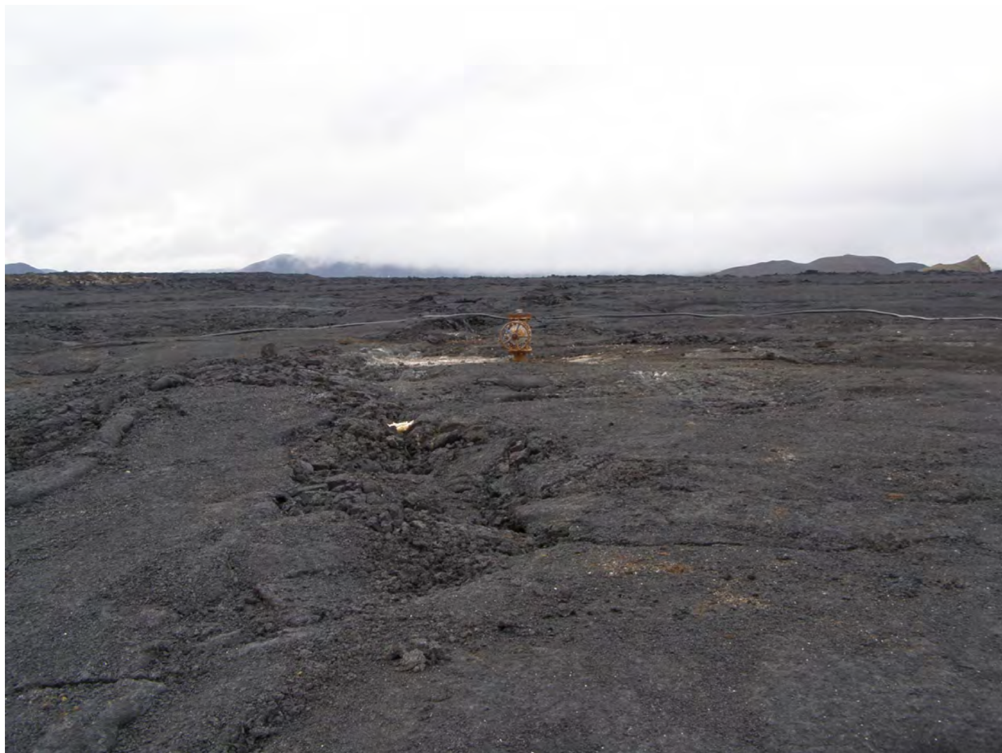
Borholan "ógurlega" í Gjástykki.....slétt helluhraun úr gosum úr Leirhnjúk 1984-1991